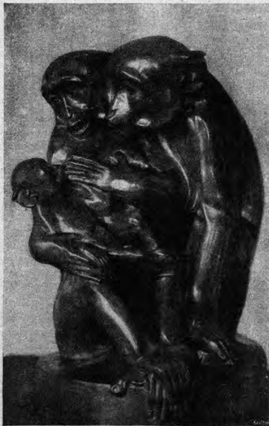
SIMAY IMRE, SIMIOJ

— Aŭ tion priskribu, kion mi komencis en