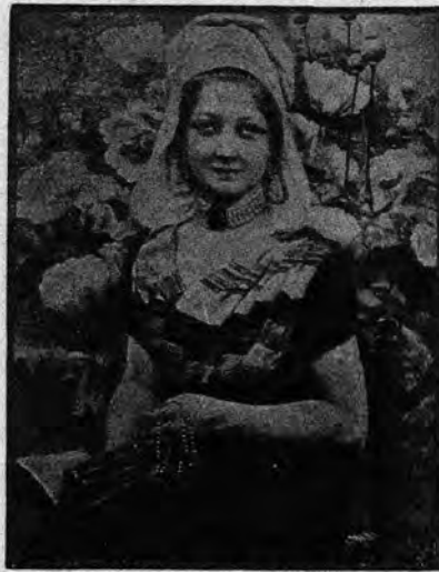
INNOCENT: DIMANĈO POSTTAGMEZE

— Vere. Vidu, jen la sola afero, kiun mi bedaŭras.