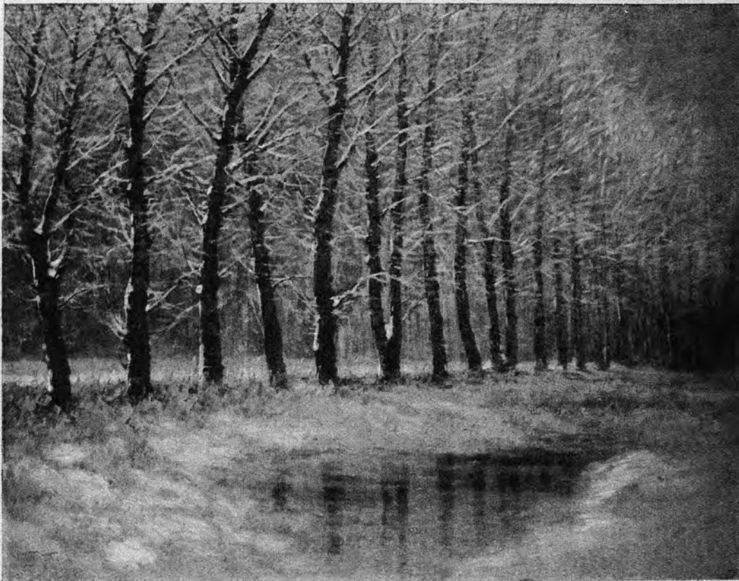
KÉZDI-KOVÁCS: FREĜA NEĜO